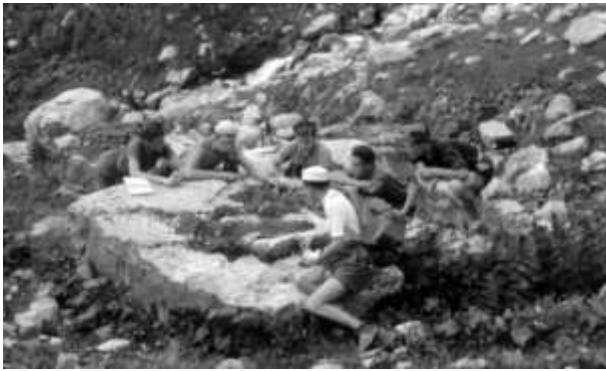
Válečná porada při hře

Švígo speleolog. Jindy tudy tryskala voda