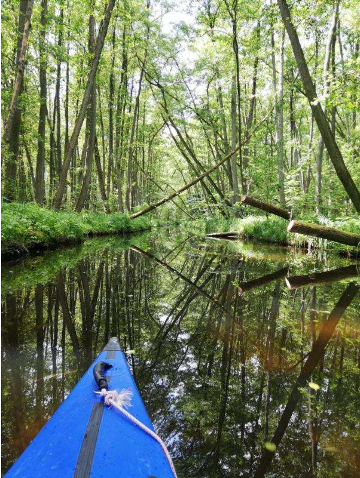
Labutí stoka 1