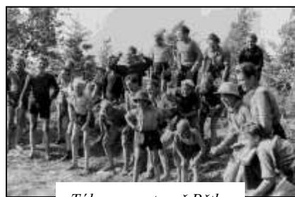
Tábor na ostrově Pětka