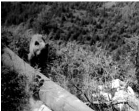
Medvěd. Prý hodný.