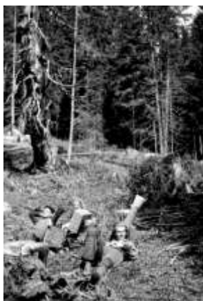
Odpočinek při vynášení