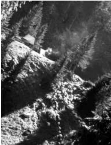
Srub a stádo ovcí. Fotograf právě padal.