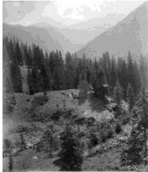
Stavba srubu je uprostřed fotografie