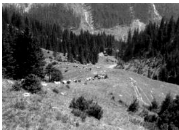
Pohled na srub od Mořského oka