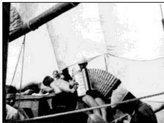
Já tam měl tahací harmoniku

Starší z nás, samozřejmě kde to jenom šlo, koukali, kde jsou nějaké holky. Nejkrásnější scéna nastala, když Braťka uklízel v přídi lodi, což dělal pravidelně. Příď byla zakrytá palubkami a měla dveře. Byla to vlastně zásobárna a všechno, co se dalo uklidit během plavby, se nastrkalo dovnitř. Braťka chtěl mít v zásobách pochopitelně přehled, tak pravidelně se muselo všechno vyndat a on si zapisoval, co tam uvnitř je a ukládal si to podle svého. Jednou, když byl zrovna uvnitř, tak přišel Julio. Catilina stál vedle mě,