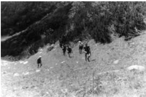
Od Tiché ke srubu