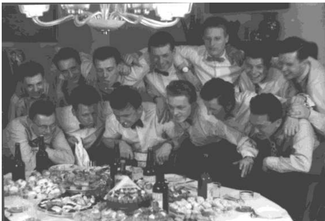
Padesátá léta, oslava výročí vydávání Plaváčka: První řada: Riki, Autogen, Švígo, Boja, Čuchně, Tonda; druhá řada: Kušnička, Strašidlo, Ludva, Pulec, Pacík, Zdeněk Chingo