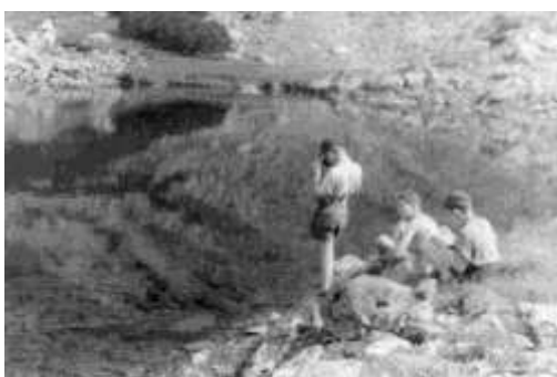
U Mořského oka nad táborem