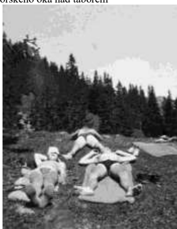
Konečně slunce. Chingo, Švígo a Woody