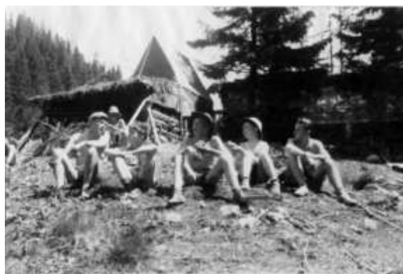
Siesta za kuchyní