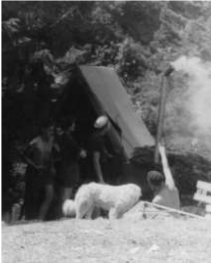
V kamech hoří! Sláva