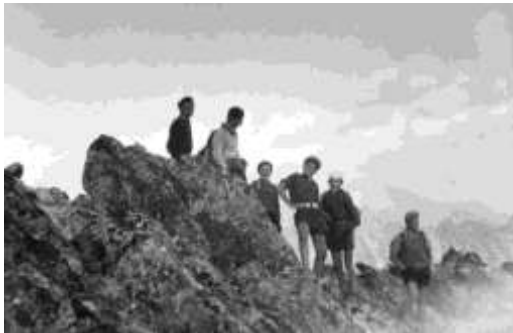
Výlet na Kriváň