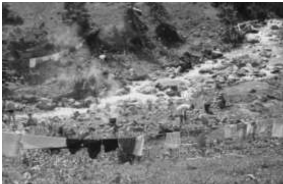
Praní a sušení prádla