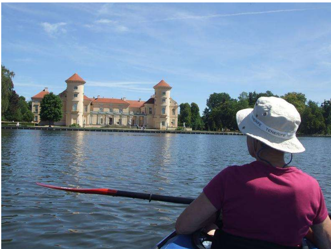
Reinsberg, volný vstup