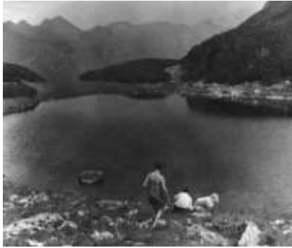
Měření hloubky Mořského oka