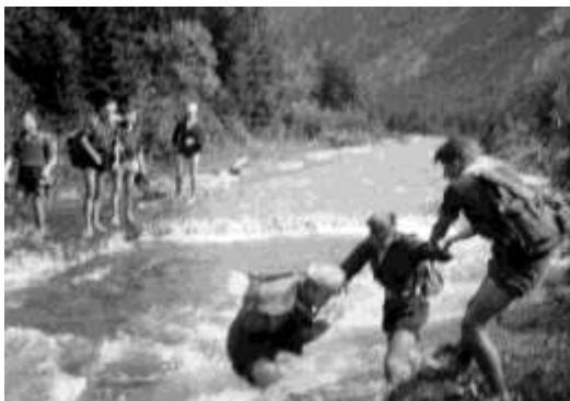
Silnička do Podbanské po povodni