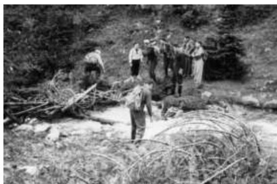
Zásobování. Přechod Tomanova potoka