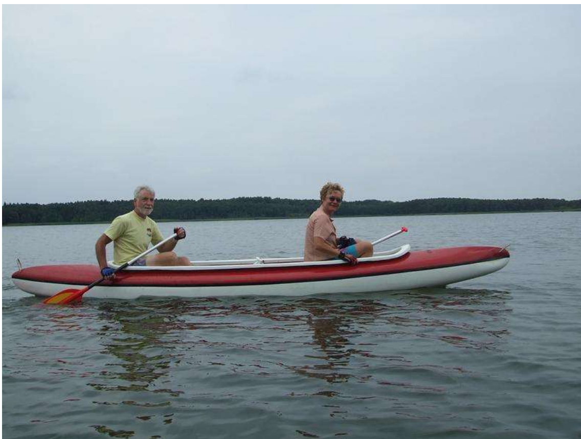
Vydra ve větru