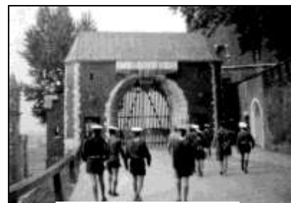
Brána hradu Wawel