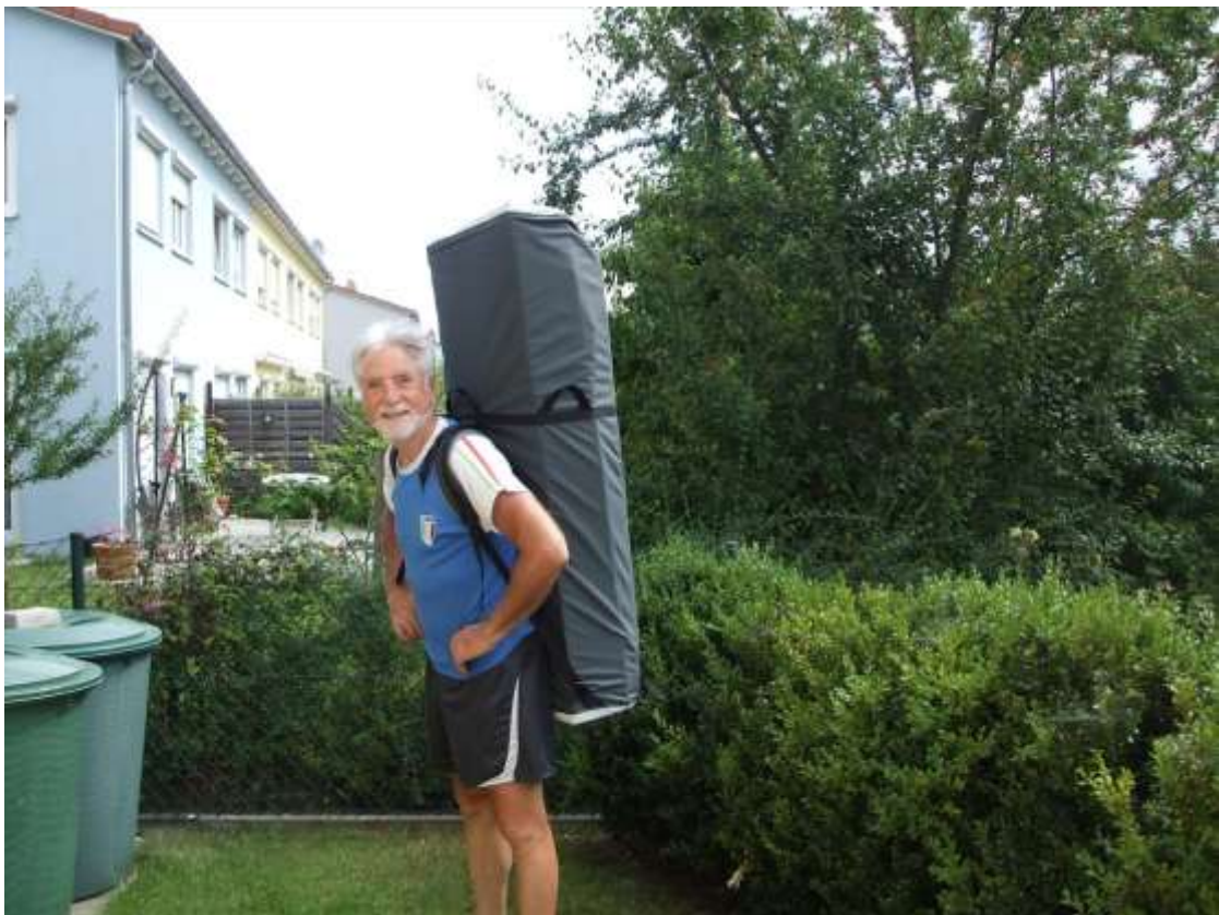
Takhle ta loď vypadá sbalená