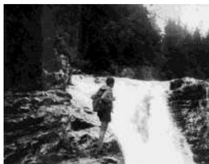
Vodopád při velké vodě