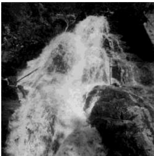
Tonda měří vodopád