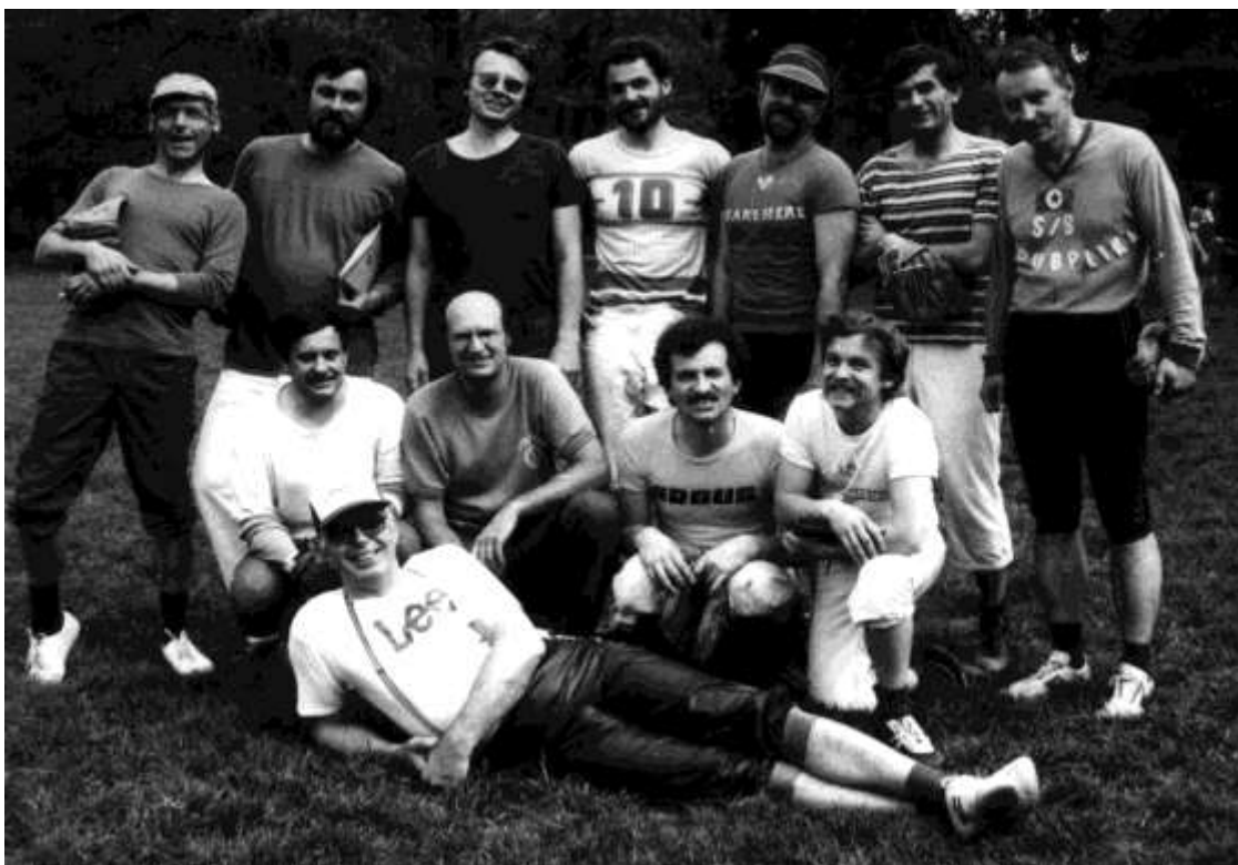
Softball 1. května 1983