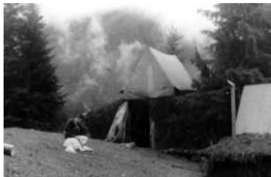
Vočko, pes Doran a srub