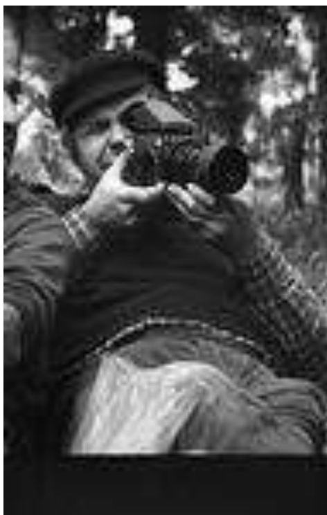
Chingo fotograf oddílu