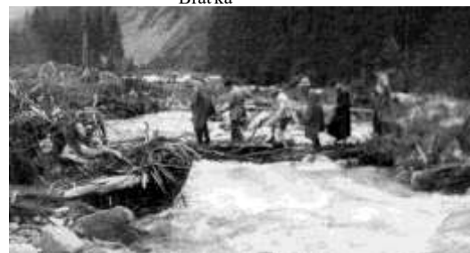
Cesta domů po povodni