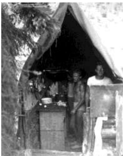
Před vyhnáním Chinga z kuchyně Tondou