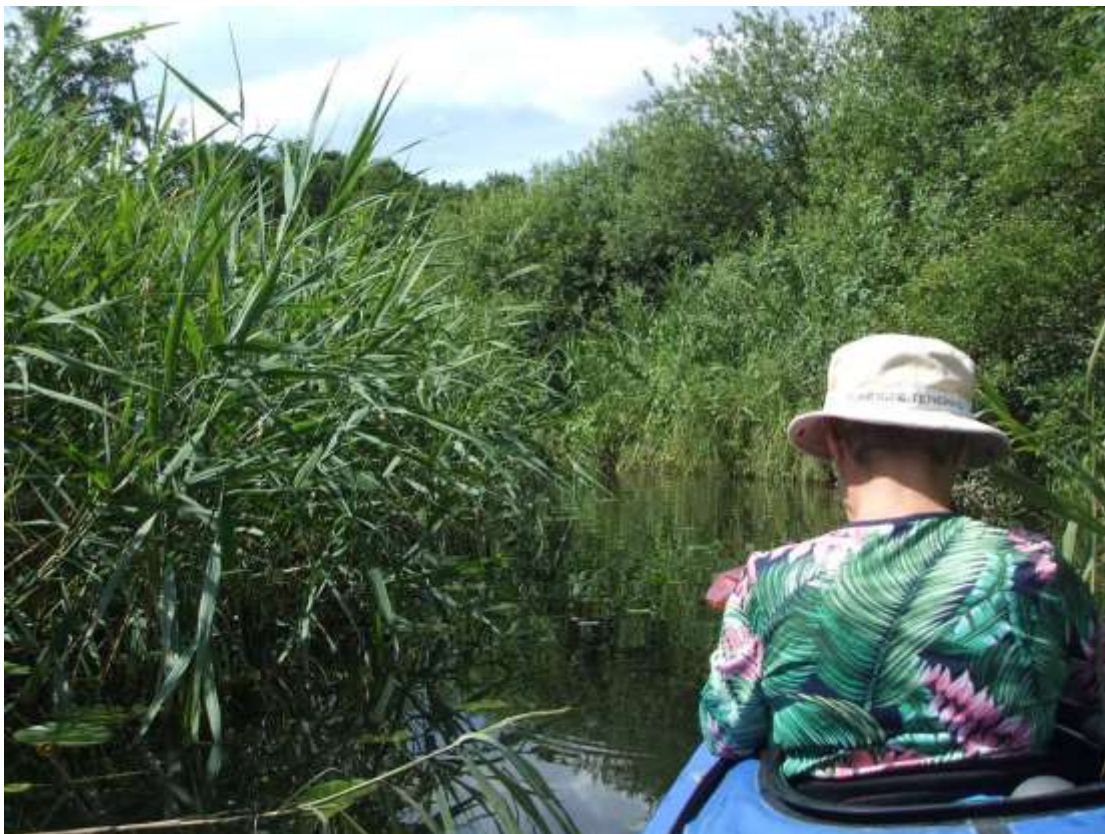
Labutí stoka 2