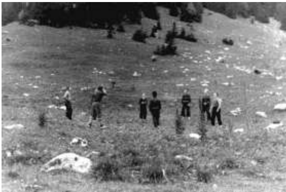
Kousek trochu rovné plochy a hrálo se