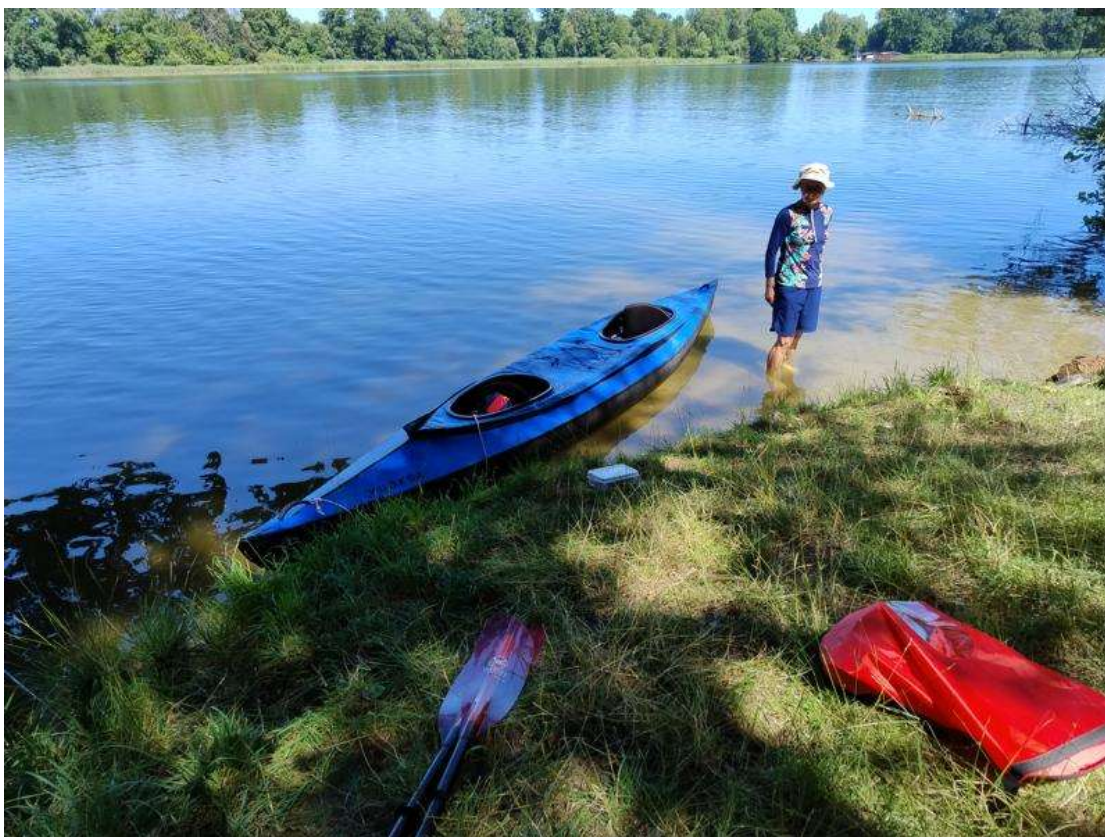
Labutí stoka 3