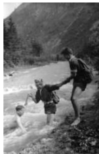
To za Černochem, co vytahuje Autogena, není řeka, ale silnice

Autoři: Autogen a Chingo. (Oba Rolleiflexy otců.)