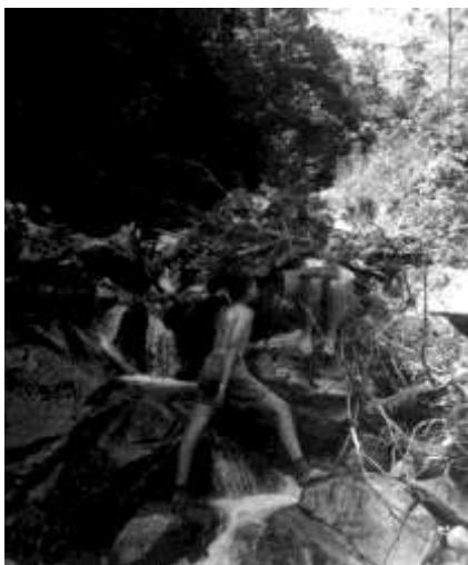
Zapisování měření vodopádů: Autogen a Měšýc