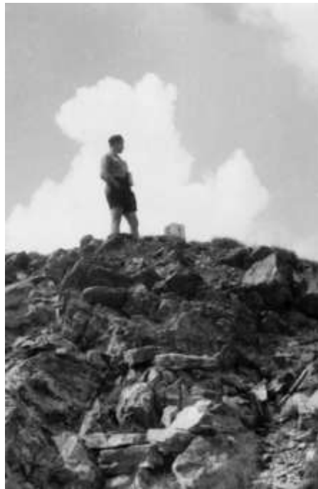
Švígo na hranici s Polskem