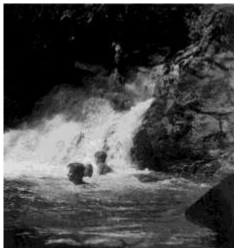
Koupání pod vodopády