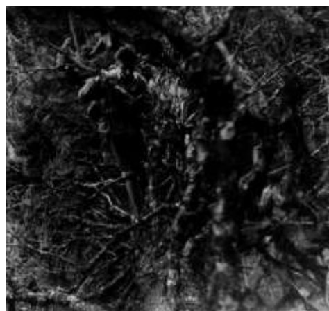
Vynášení věcí. Vidíte Šviga a Tondu?